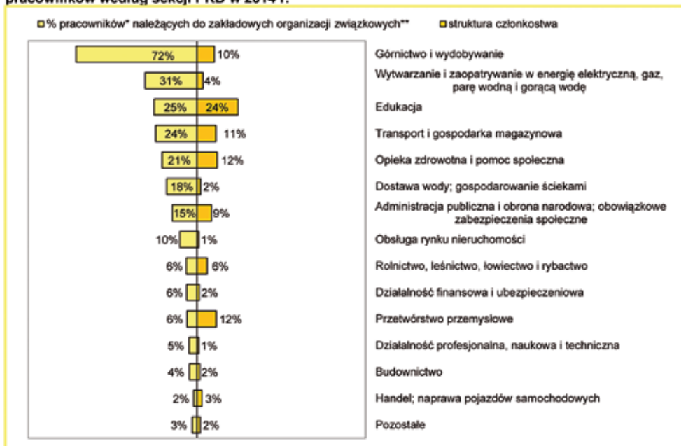
Wykres 3. Struktura członkostwa zakładowych organizacji związkowych oraz odsetek uzwiązkowienia pracowników według sekcji PKD w 2014 r.

* Uwzględniono liczbę osób pracujących w podmiotach zatrudniających powyżej 9 osób na koniec trzeciego kwartału 2014 r., za: Zatrudnienie i wynagrodzenia w gospodarce narodowej w 2014 r. , GUS 2015 tabl. 5 Pracujący według sekcji gospodarki narodowej w 2014 r. , s. 24. Z wyjątkiem sekcji Rolnictwo, leśnictwo, łowiectwo i rybactwo , gdzie uwzględniono liczbę wszystkich osób pracujących na dzień 31.12.2013 r., za: Rocznik Statystyczny RP 2014 , GUS 2014, Tabl. 6 (165). Pracujący a według sekcji i działów , s.241.