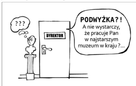
Protest Muzealników 2015