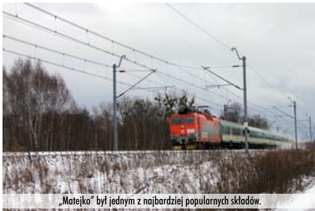
„Matejko” był jednym z najbardziej popularnych składów.

Powody zniknięcia pociągów TLK i PR na tej trasie nie są tajemnicą. Co prawda będziemy mieli dwa pociągi TLK na trasie Kraków – Warszawa (jeden przed godziną